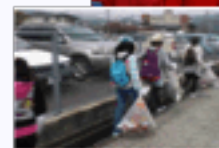
チームごとにゴミ拾い開始