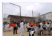
『スポーツ GOMI 拾い』スタート!

このように、歩育コーチは歩育プログラムの計画づくり(子ども向け・家族向けウォーキングイベントの企画)や、歩育イベントでのコーチングを通じて子ども達の成長をサポートしていただきます。