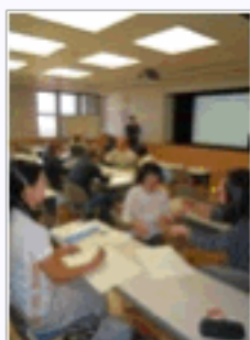
「コーチ役」と「子ども役」に分かれて、コーチングを実践