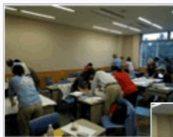
アイデアがまとまったらプログラムの内容を模造紙に書いてグループごとに発表します。