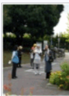
プログラムをつくるために公園で事前調査を行います