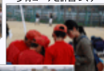
歩育コーチと計画づくり